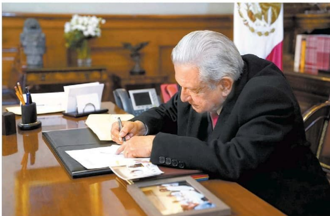
El mandatario publicó una sentencia para evitar sanciones a su vocero y su jefa de redes sociales.

Debate político. Consumado el revés al decretazo , irá por una reforma electoral pasada la consulta revocatoria; ex consejeros, ex magistrados y especialistas ven riesgo para el avance de la democracia